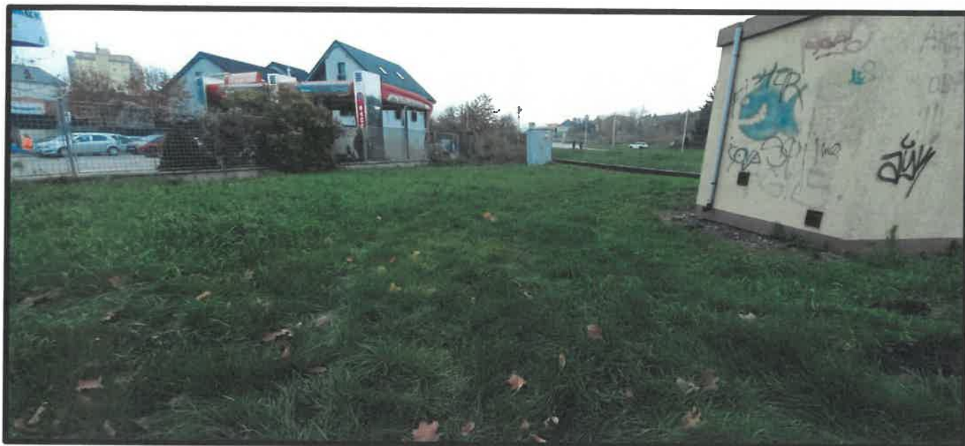
Obr. č. 1 – pohľad z Braneckého ulice