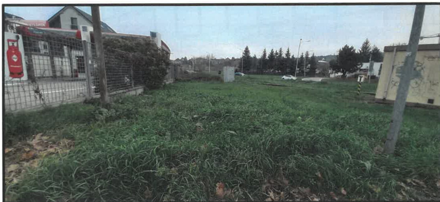
Obr. č. 8 – pohľad z Braneckého ulice