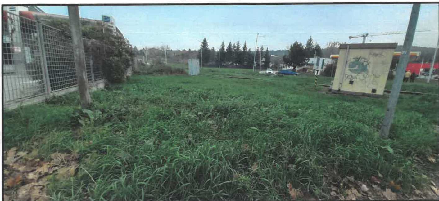
Obr. č. 3 – pohľad z Braneckého ulice