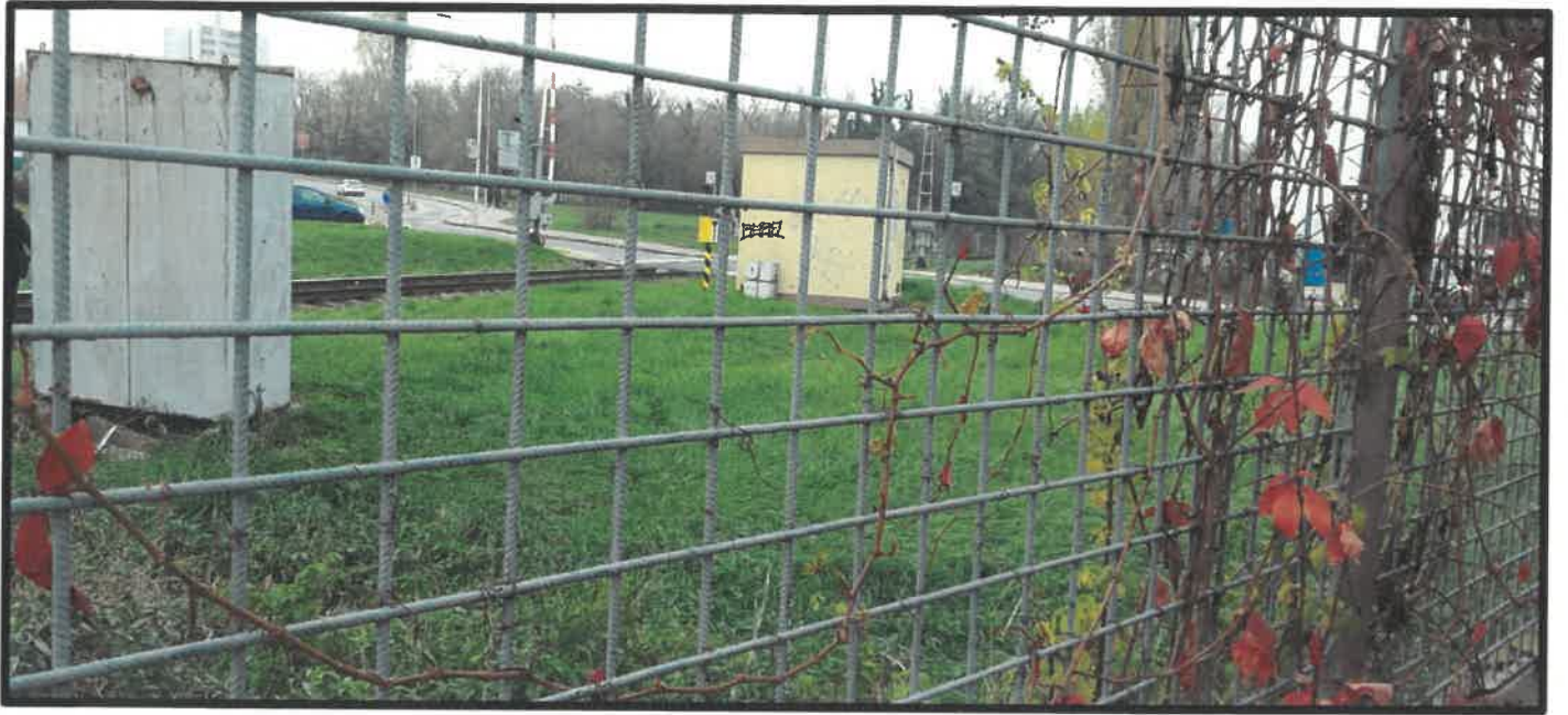
Obr. č. 5 – pohľad z pozemku žiadateľa