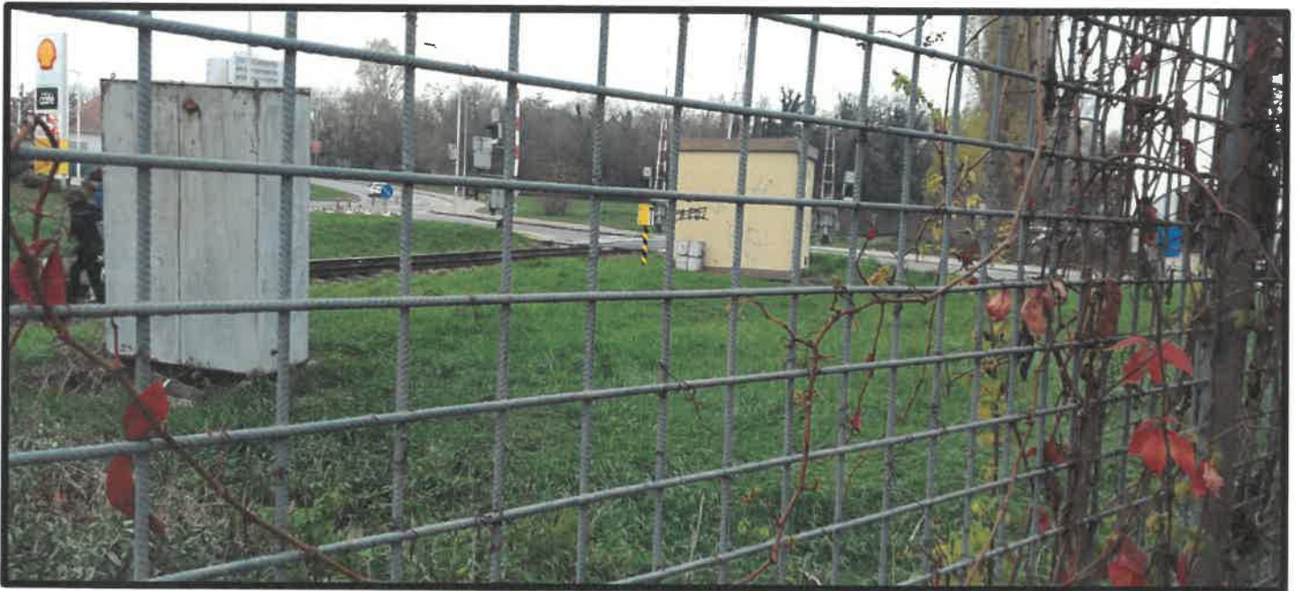
Obr. č. 6 – pohľad z pozemku žiadateľa