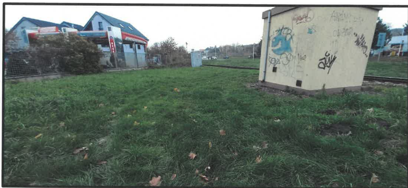
Obr. č. 2 – pohľad z Braneckého ulice