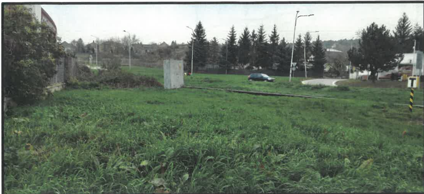
Obr. č. 7 – pohľad z Braneckého ulice