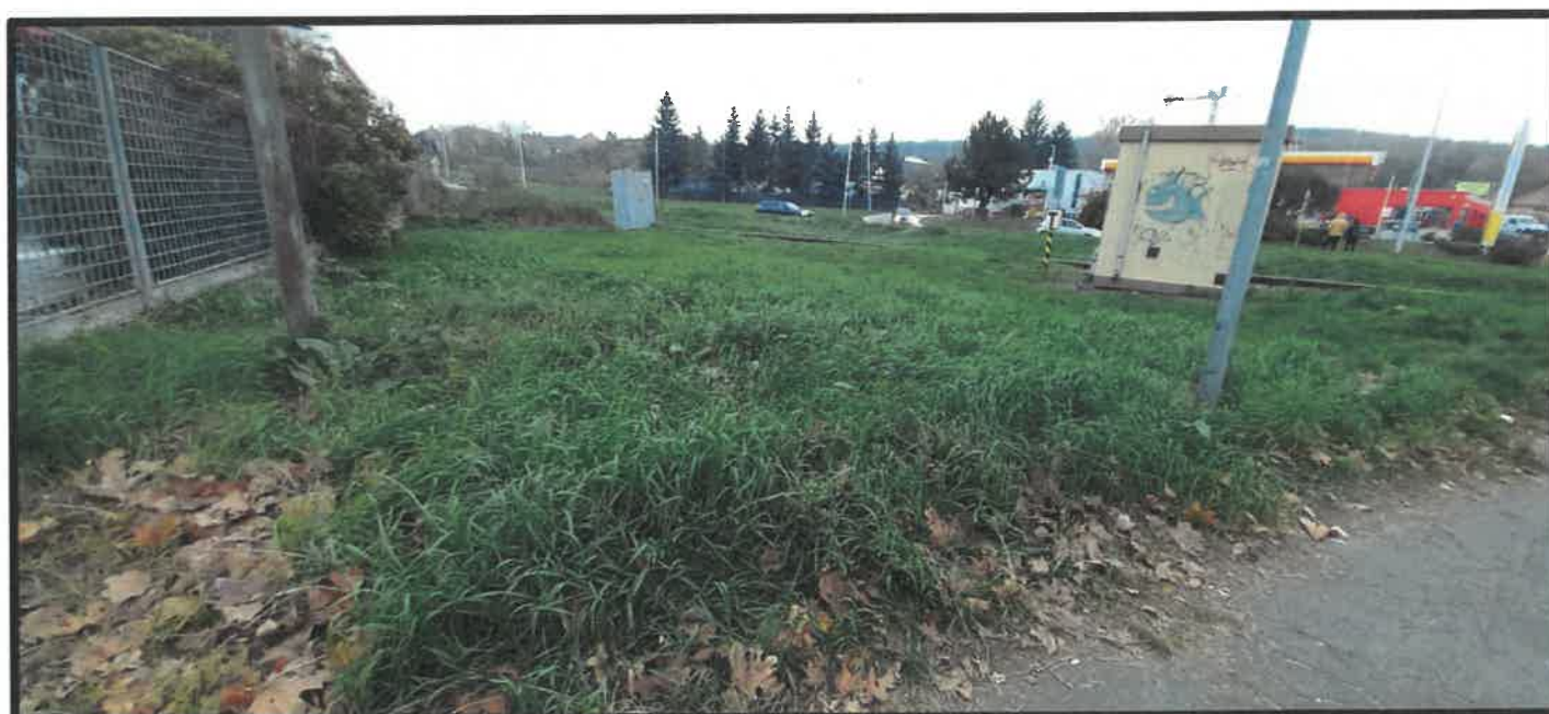
Obr. č. 4 – pohľad z Braneckého ulice