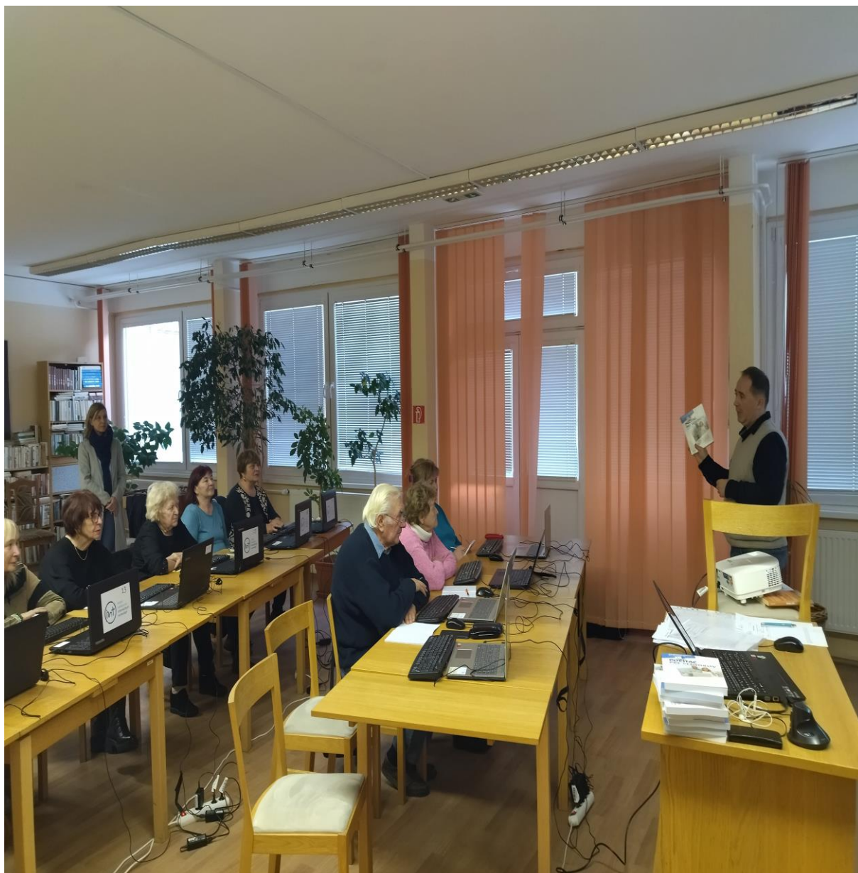
Vzdelávanie seniorov v digitálnych zručnostiach, november – december 2022