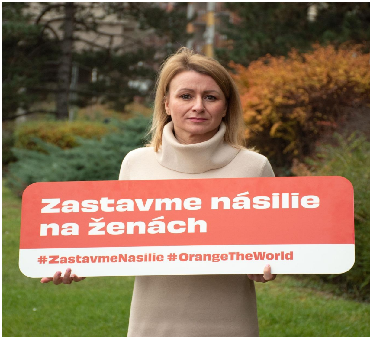
Podpora kampane: Zastavme násilie, november 2022