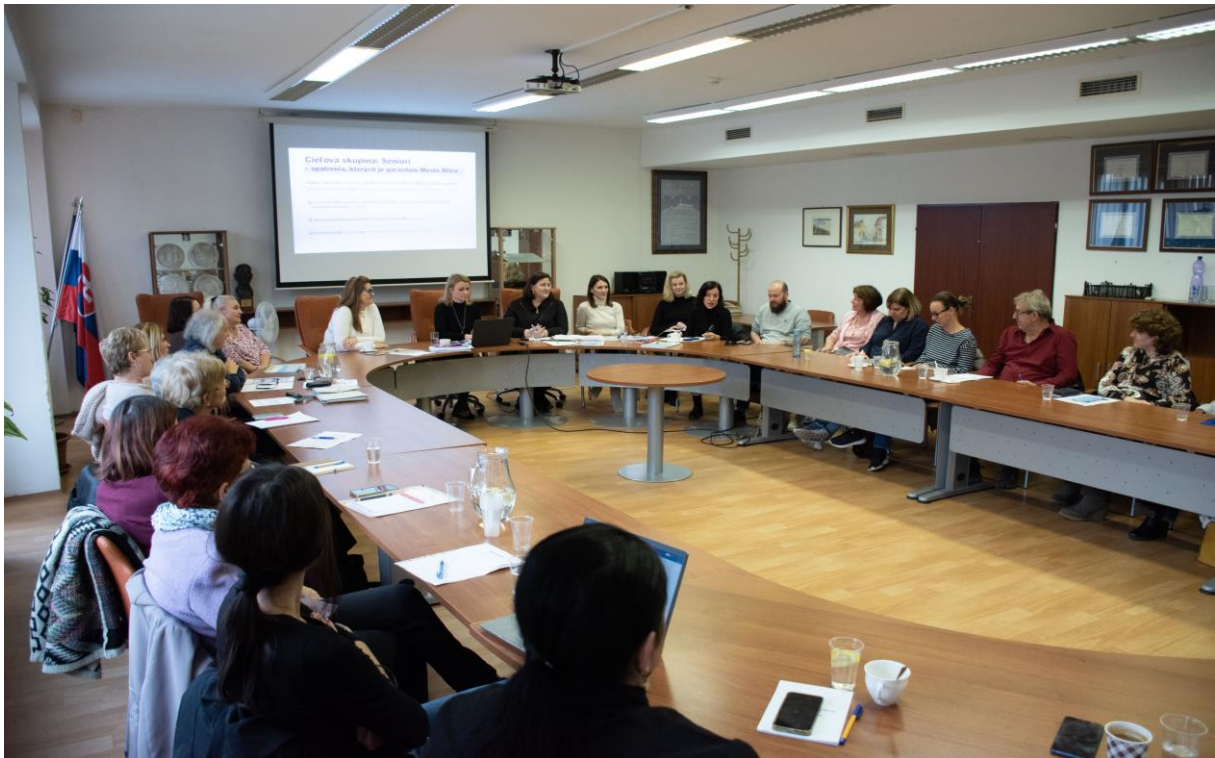
Pracovné stretnutie Implementačných skupín k cieľom a opatreniam III. Komunitného plánu sociálnych služieb v meste Nitra, november 2022