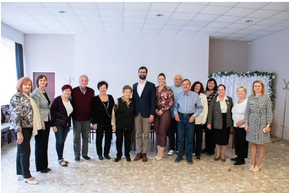
Posledné zasadnutie Rady seniorov mesta Nitry, september 2022