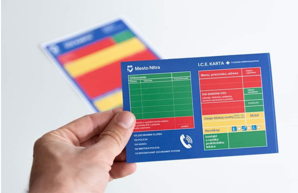
Seniorská obálka a I.C.E. karta, júl 2022