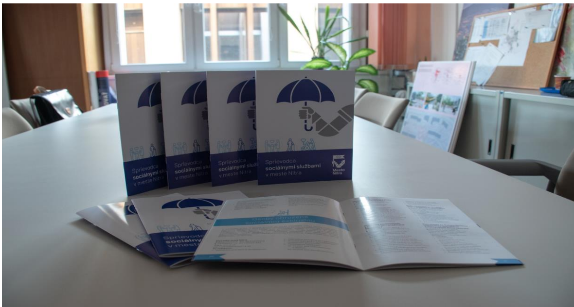
Nový sprievodca sociálnymi službami v meste Nitra, november 2022