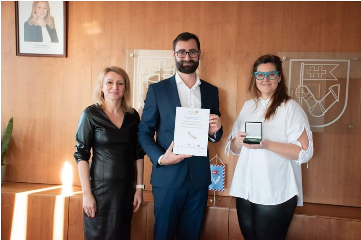
Ocenenie Senior Friendly 2022 pre Mestský úrad v Nitre, október 2022