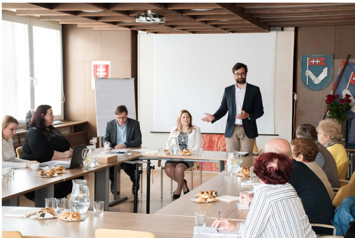
Ustanovujúce zasadnutie Rady seniorov mesta Nitry, MsÚ Nitra, apríl 2023