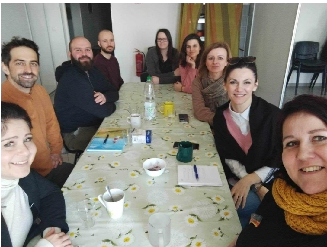
Pracovné stretnutie s neziskovou organizáciou Človek v ohrození, Komunitné centrum Orechov dvor, marec 2023.