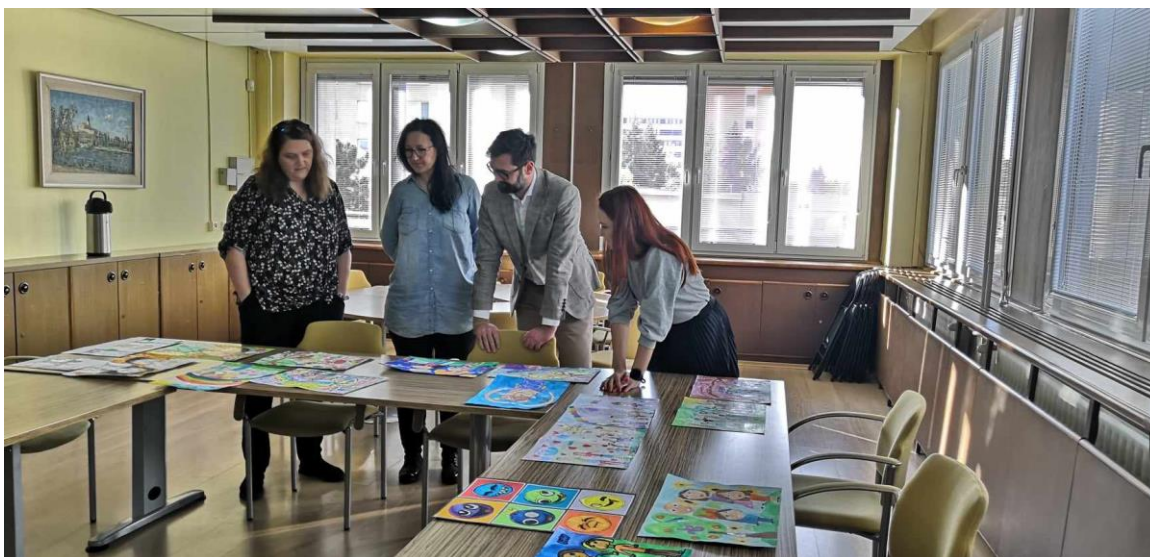
Hodnotenie výtvarnej súťaže pod názvom „Ako by vyzeral svet bez násilia“, podpora a zviditeľnenie témy ochrany detí pred násilím, MsÚ Nitra, november 2023