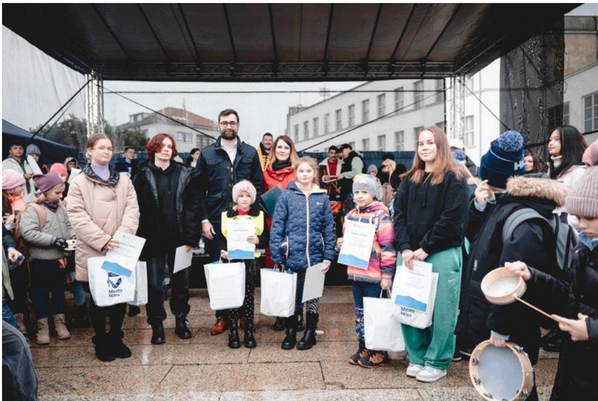
Vyhodnotenie výtvarnej súťaže názvom „Ako by vyzeral svet bez násilia“, podpora a zviditeľnenie témy ochrany detí pred násilím, Nitra, november 2023