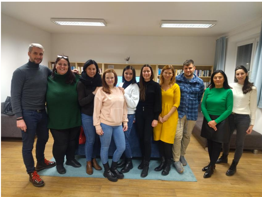
Pracovné stretnutie Repuls, Magistrát hlavného mesta SR Bratislava, Budatínska ul., Bratislava, november 2023