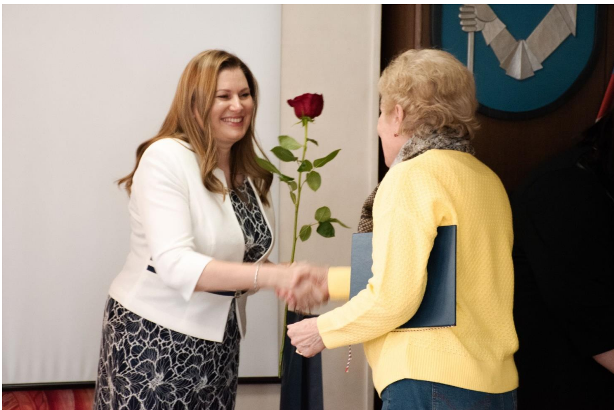
Ustanovujúce zasadnutie Rady seniorov mesta Nitry, MsÚ Nitra, apríl 2023