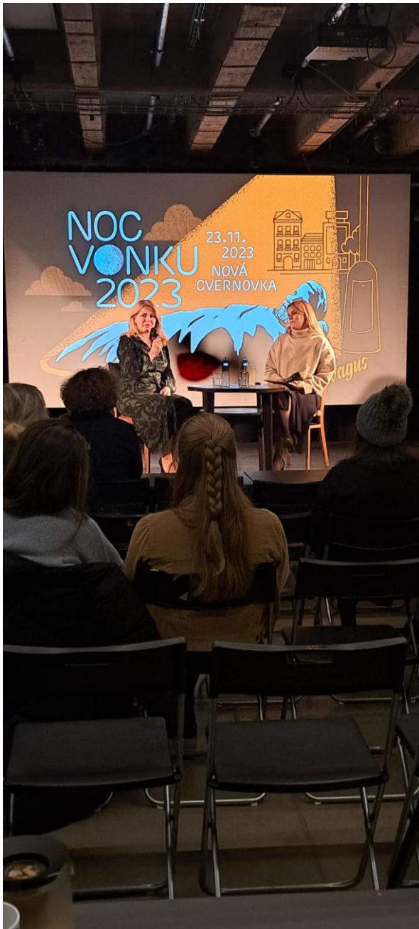
Podujatie neziskovej organizácie Vagus – Noc vonku, Nová cvernovka, Račianska ul., Bratislava, november 2023