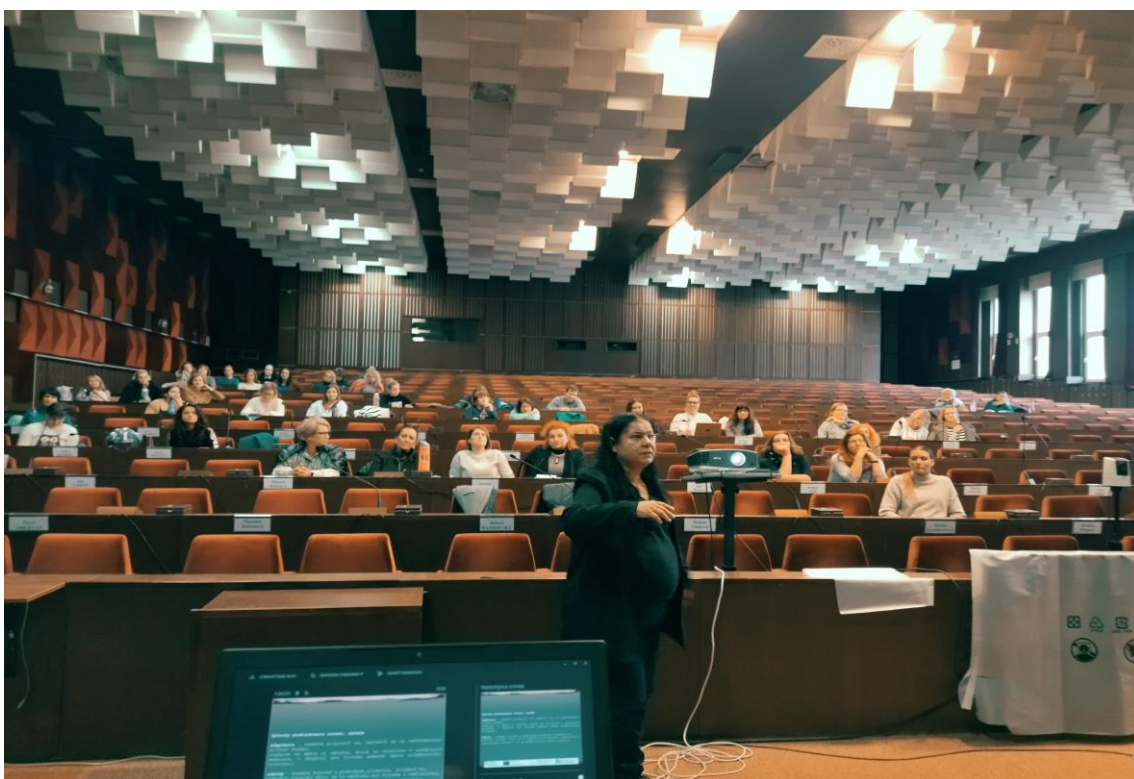
Vzdelávanie poskytovateľov sociálnych služieb, MsÚ Nitra, november 2023