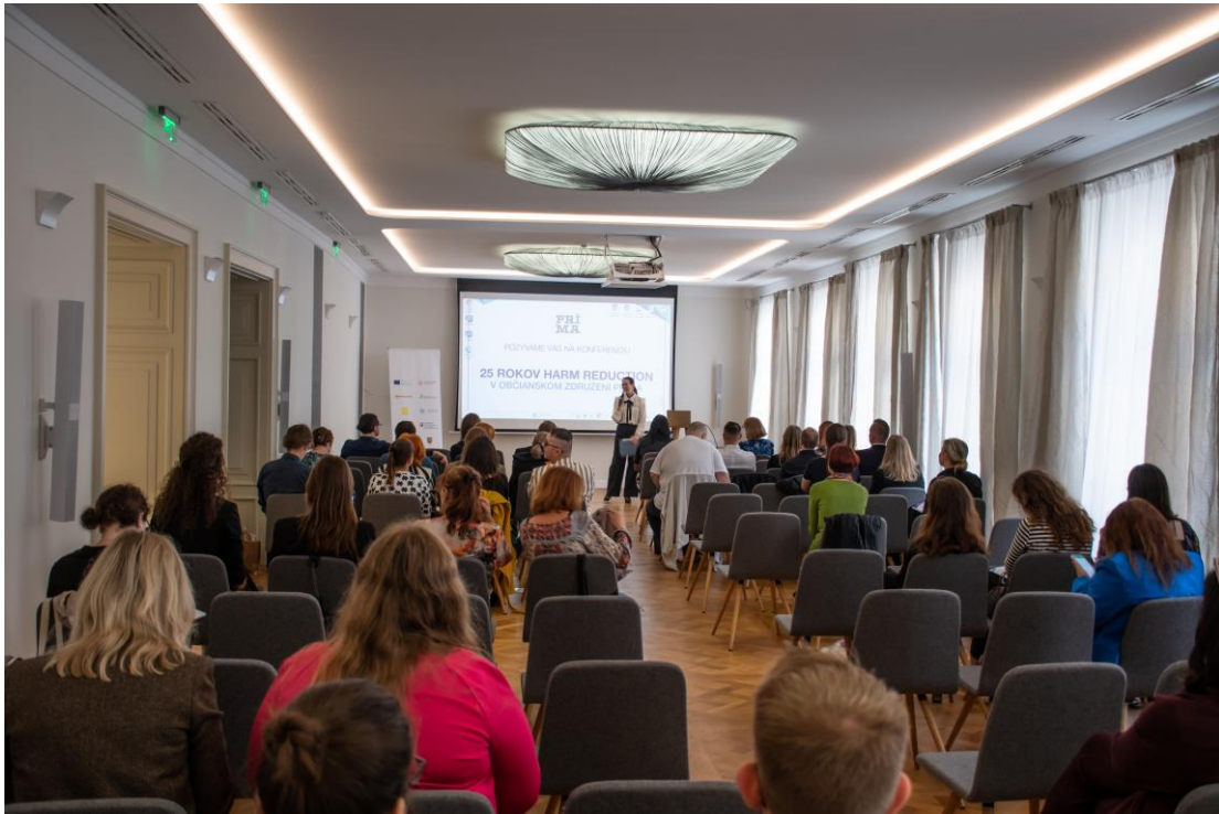
Adiktologická konferencia „25 rokov Harm Reduction v OZ Prima, Bratislava, október 2023