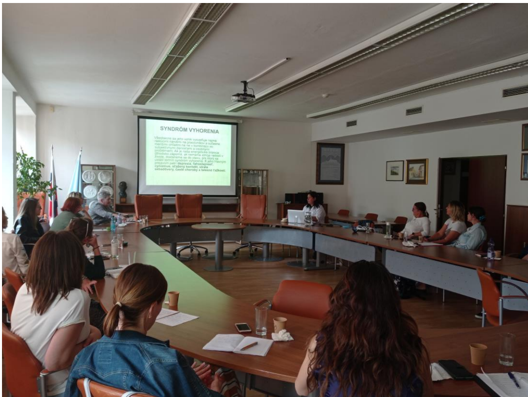
Staráme sa o duševné zdravie pedagógov – vzdelávanie pre pedagógov základných škôl v Nitre, jún 2023