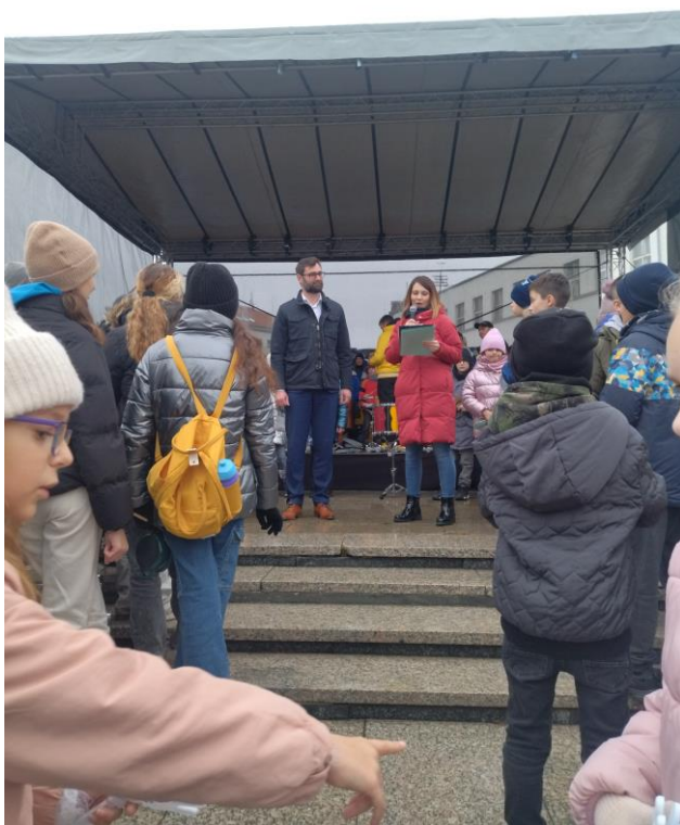
Bubnovačka, Svätoplukovo nám., Nitra, november 2023