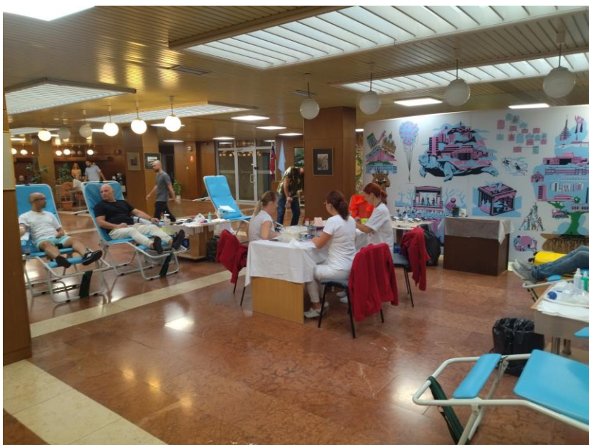
Primátorská kvapka krvi, MsÚ Nitra, marec 2023