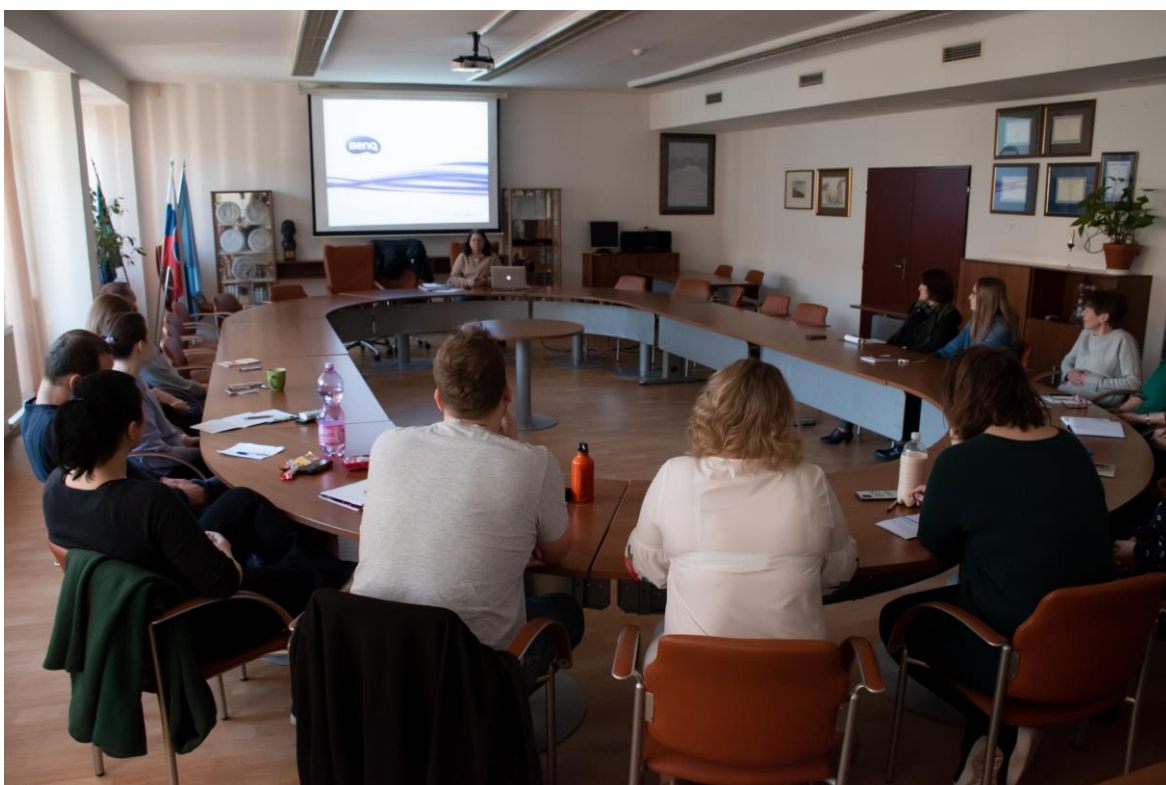
Vzdelávanie zamestnancov MsÚ Nitra, zamestnanci Klientského centra služieb, apríl 2023