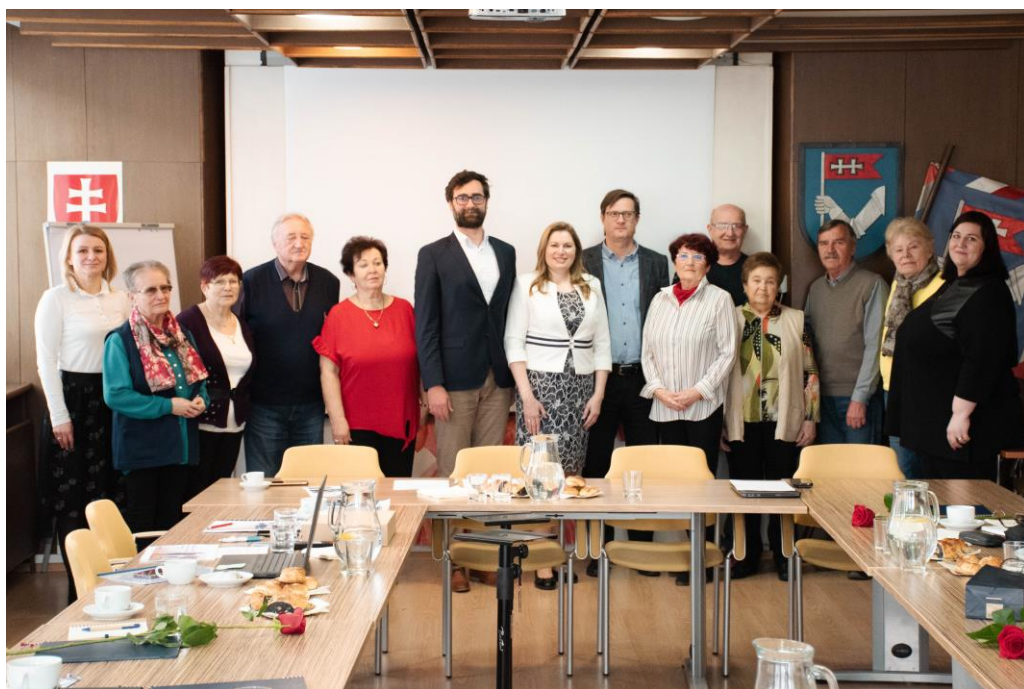
Ustanovujúce zasadnutie Rady seniorov mesta Nitry, MsÚ Nitra, apríl 2023