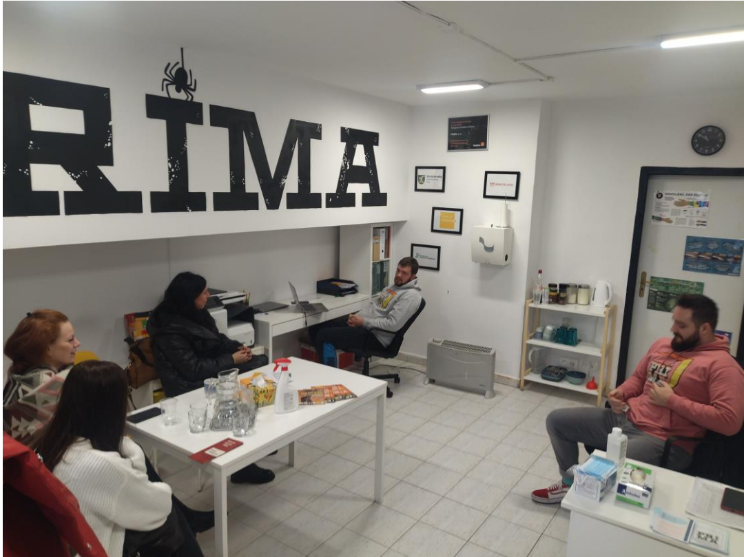
Pracovné stretnutie s OZ Prima – Káčko, Kopčianska ul., Bratislava, november 2023