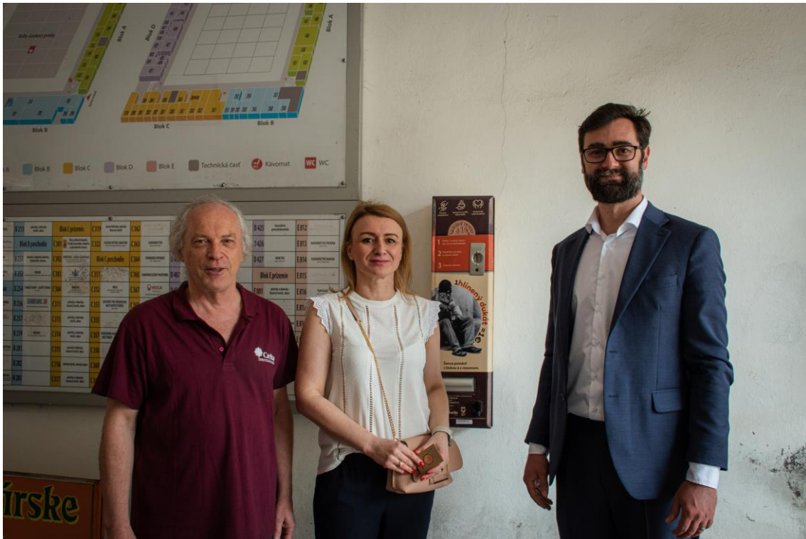
Spustenie automatu „Hlinený dukát“, Mestská tržnica, Nitra, jún 2023