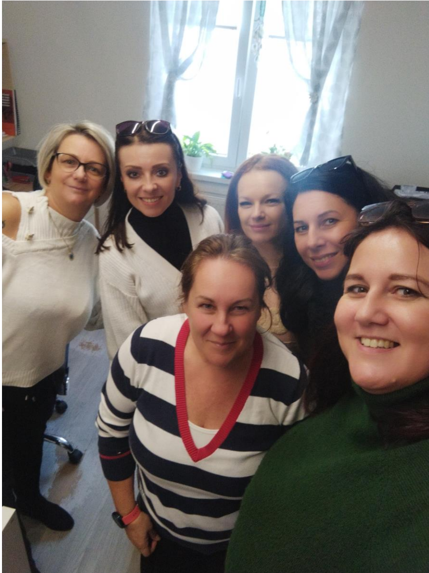
Pracovné stretnutie Komunitné centrum Plavecký Štvrtok, Plavecký Štvrtok, november 2023